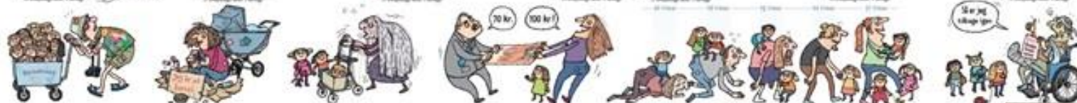
SEKS UGERS FERIE LØN UNDER BARSSEL ARBEJDSMARKEDSPENSJON OVERENKOMSTER MED BESTEMMELSER OM LØN OG ARBEJDSFORHOLD FRA 60 TIL 31 TIMERS ARBEJDSUGE LØN